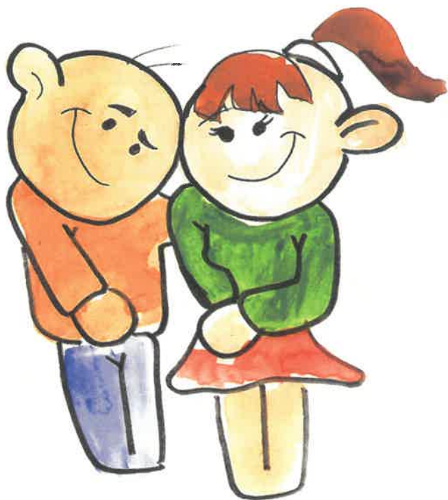
ILUSTRACIÓN: DAVID MARTÍNEZ BUCIO.